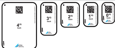
Image plate scanner model

VistaScan Ultra View VistaScan Mini View 2.0 VistaScan Mini Easy 2.0 VistaScan Nano (all models)