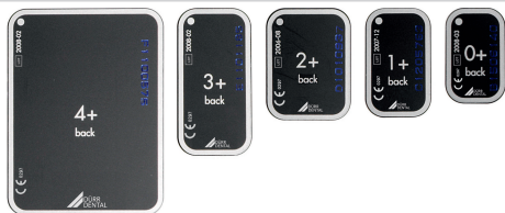
Image plate scanner model

VistaScan Perio (all models) VistaScan Ceph (all models) VistaScan Intra (all models) VistaScan Pano (all models) VistaScan Omni (all models) VistaScan Combi (all models) VistaScan Mini View VistaScan Mini Plus VistaScan Mini Easy VistaScan Mini